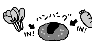
ハンバーグにみじん切りにした野菜を加える。