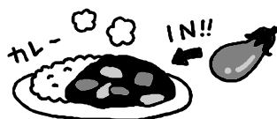
カレーライスに苦手な野菜を加える。