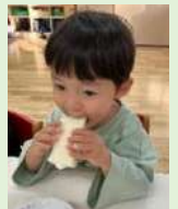
食パンで ロールケーキ作り