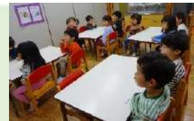
栄養指導 郷土料理についての 話を聞きました