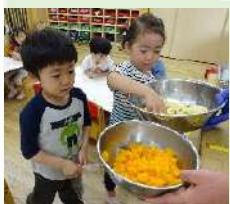
ミックスジュース 作り